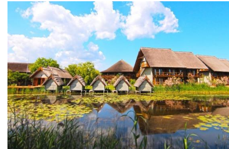
Green Village Resort, Delta Dunarii