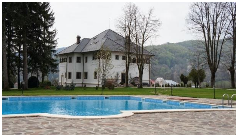
Conacul lui Maldar, Maldaresti, Valcea